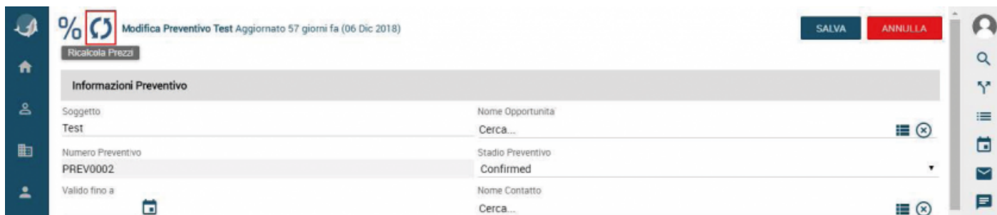
Figura 15 - Ricalcola prezzi

Questa funzionalità è identificata dal pulsante “Ricalcola Prezzi e Sconti” presente all’interno della scheda Preventivo. Il pulsante è disponibile solamente per il modulo preventivi e in sede di creazione / modifica del Preventivo.