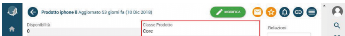
Figura 8 - Anagrafica Prodotto - Classe Prodotto

A seguito dell'installazione del componente aggiuntivo, all'interno della scheda Prodotto sarà automaticamente disponibile il campo "Classe Prodotto". Tale campo dovrà essere valorizzato con l'opzione corrispondente tramite picklist1. Nell'esempio di seguito riportato il campo è stato valorizzato con "Core".