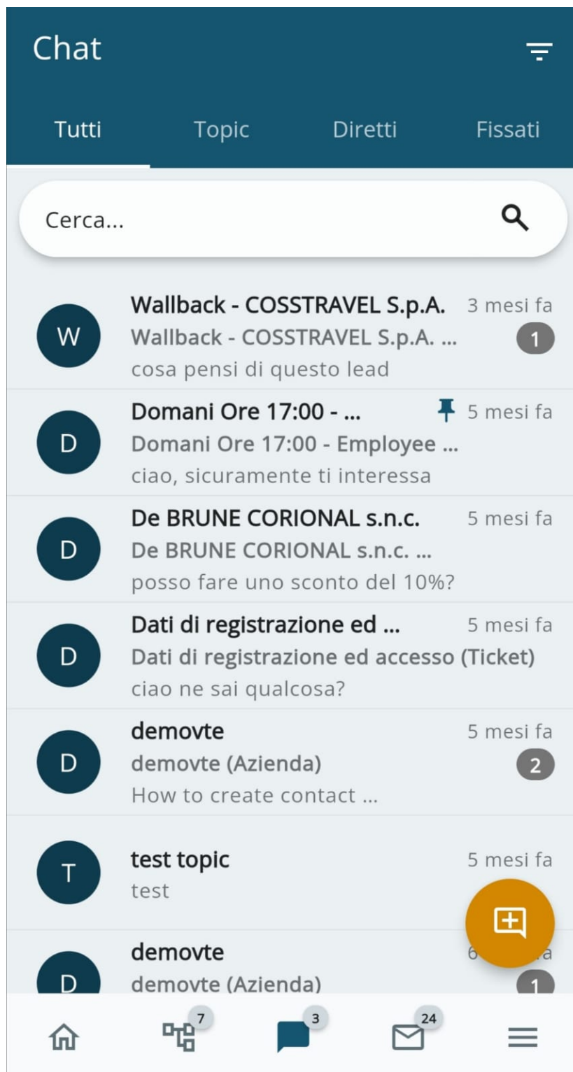
Dettaglio lista Conversazioni attive

Cliccando sull'apposita icona, presente nella barra in basso, si può aprire il pannello delle Conversazioni come mostrato di seguito.