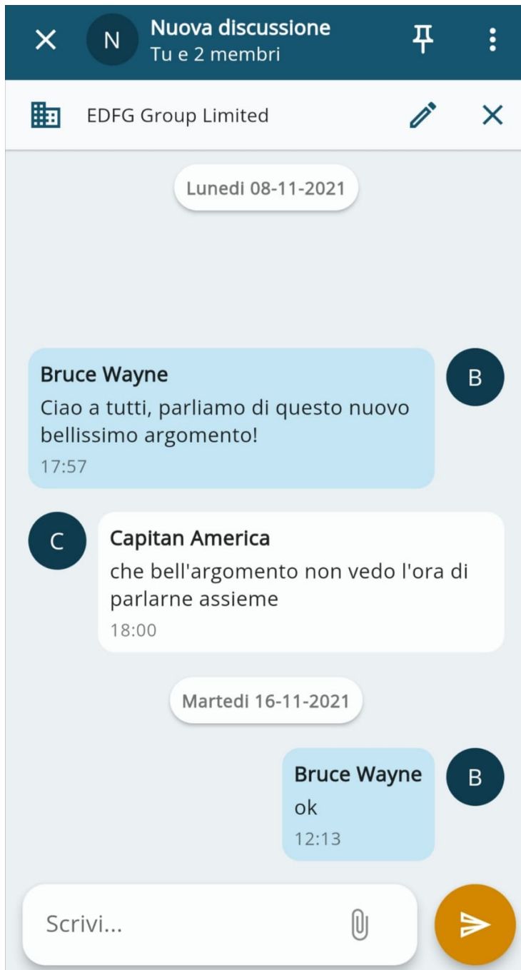
Dettaglio composizione di una Conversazione

Quando si inizia una nuova Conversazione o rispondiamo ad una esistente, ci troviamo in una schermata come quella in figura, nella quale possiamo scrivere e selezionare gli utenti destinatari, come quella visualizzata in seguito.