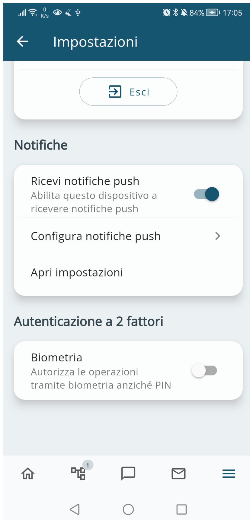
Dettaglio Impostazioni (secondo scroll)