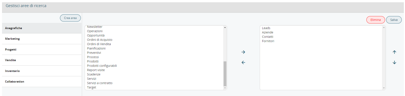
Schermata di scelta, modifica o creazione Aree

La tipologia di testo inserito, qualora non fosse presente all'interno di tutti i filtri usati dall'utente, non darà alcun risultato nella ricerca. Ad esempio, se ricerchiamo un indirizzo email e il campo non è presente in nessuna colonna di nessun filtro, vtenext non troverà il dato inserito.